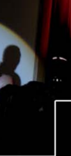
Verino Prix du Jury Prix du Public