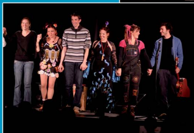
Les jeunes Talents