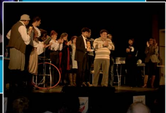
Remise des Prix