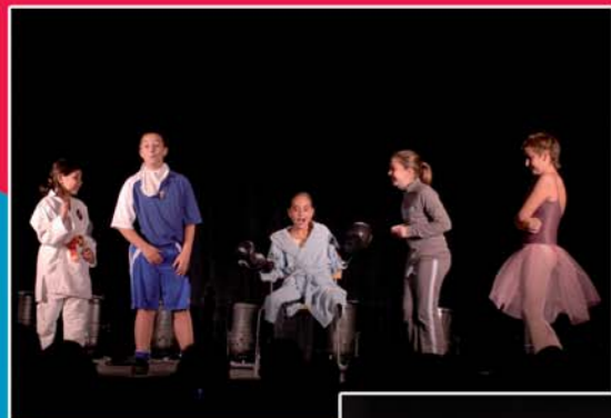
Concours des Minis Canailles